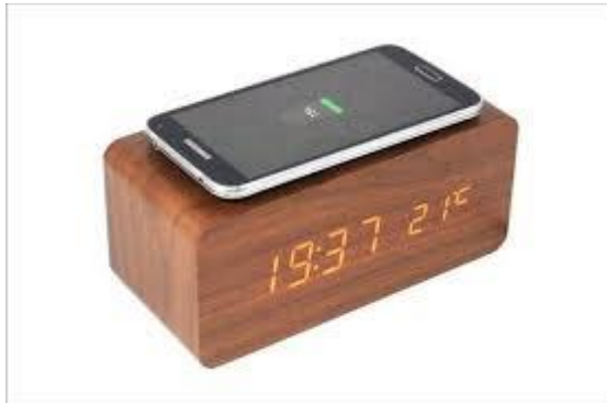
Mobiele telefoon of wekker?

aan dat ze langer dan twee uur per dag bezig zijn op hun mobiele telefoon.